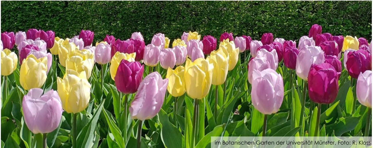
im Botanischen Garten der Universität Münster

Liebe Staudenfreundinnen, liebe Staudenfreunde,