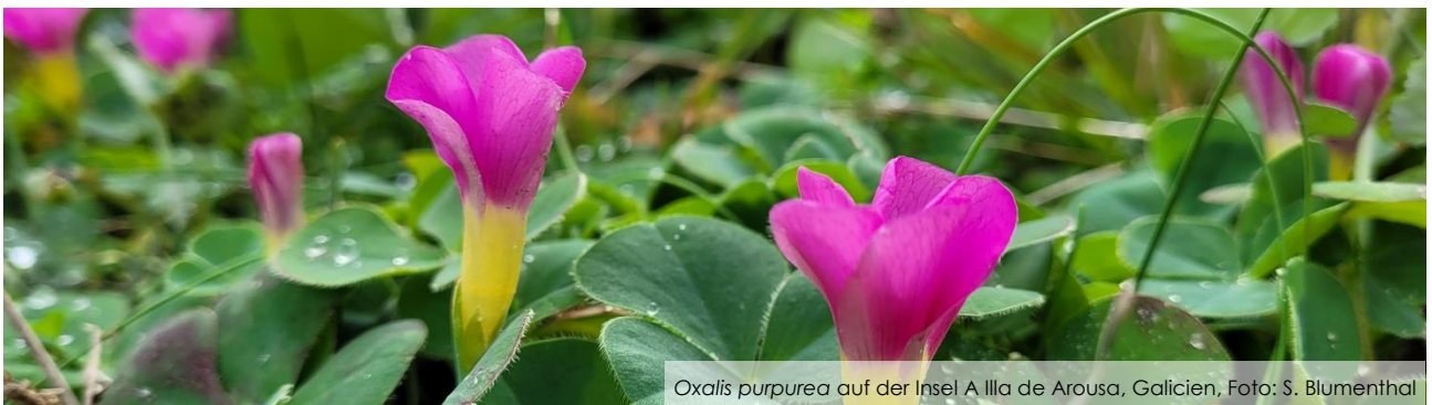
Oxalis purpurea auf der Insel A Illa de Arousa, Galicien