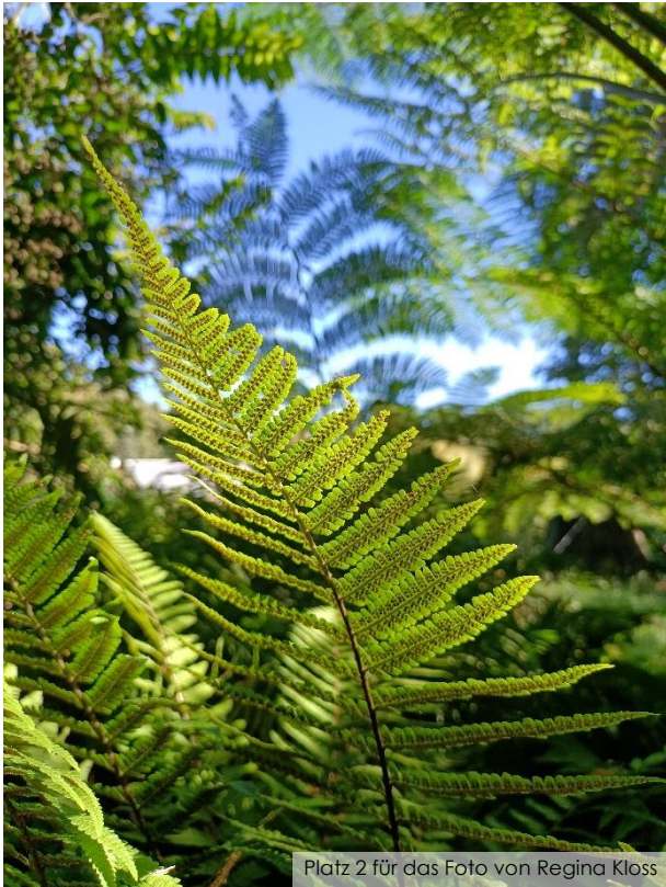
Platz 2 für das Foto von Regina Kloss