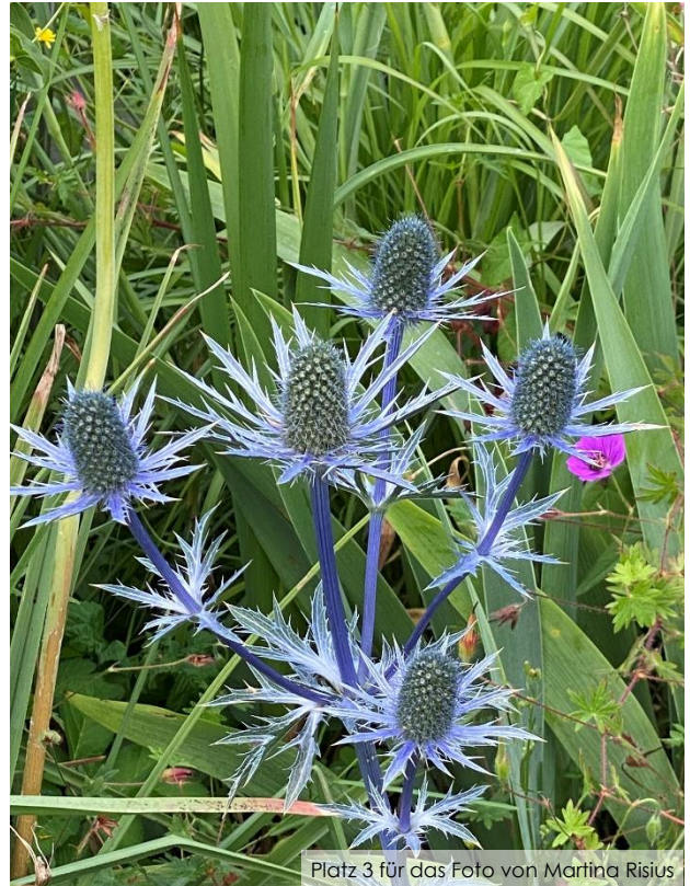
Platz 3 für das Foto von Martina Risius

Das Leitungsteam nimmt gerne noch Ihre Themenvorschläge für den diesjährigen Fotowettbewerb entgegen.