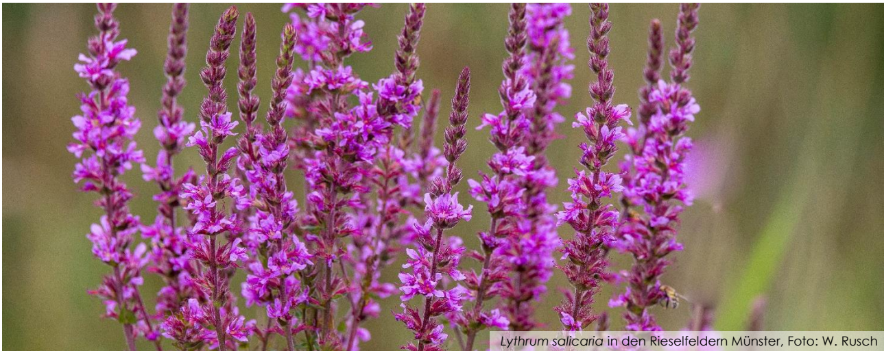
Lythrum salicaria in den Rieselfeldern Münster

Liebe Staudenfreundinnen, liebe Staudenfreunde,