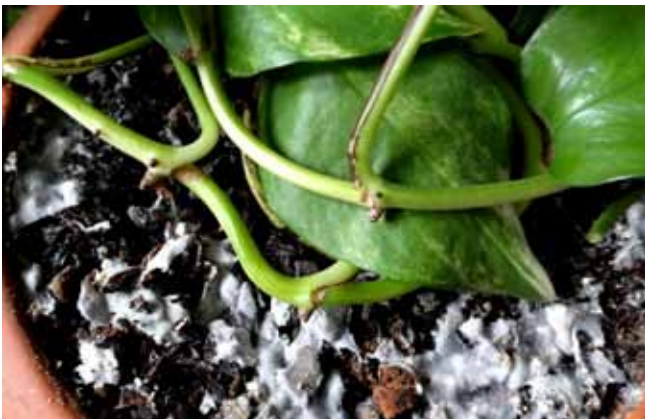
Pilzbelag auf der Topferde

Woher kommen die Pilzbeläge auf der Zimmerpflanzenerde?