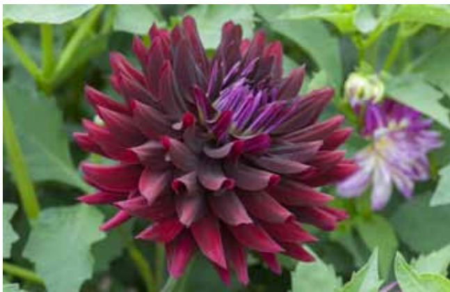
Dahlia 'Hollyhill Black Beauty'

Gehen wir kurz einmal der Frage nach, warum Pflanzen uns überhaupt farbig erscheinen. Die Farben basieren auf Strukturen 3 oder Pigmente.