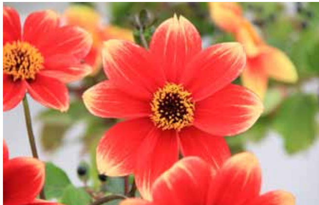
Dahlia 'Feuervogel'

Dies führt dann immer zu längeren Erörterungen über Mutationen und über die sog. Sport-Bildung, die bei Dahlien gelegentlich anzutreffen ist. Dieses Phänomen kommt aber nur selten vor und erfasst auch nicht gleichmäßig den ganzen Garten. Die einfachste Erklärung ist dann immer, dass es unterschiedlich stabile Sorten gibt und dass sich viele hervorragende Sorten nicht so lange halten wie zahlreiche alte, bewährte Züchtungen. Letztere kommen immer durch den Sommer und vor allem auch durch den langen Winter. Sie halten jahrzehntelang und vermehren sich entsprechend gut, manche Sorten wie die Kartoffeln. Und