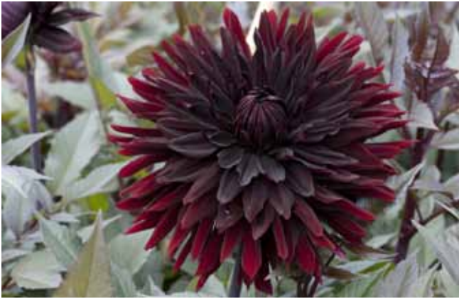
Dahlia 'Black Jack'

sollen aber im Rahmen der pflanzlichen Fortpflanzung dies erreichen. Welche Möglichkeiten bieten sich den Pflanzen? "Den geringsten Aufwand", schreibt Dietrich Zawischa, "erfordert eine weiße Blüte. Die Blütenblätter enthalten kein Chlorophyll und keinen anderen Farbstoff. Die weiße Farbe kommt zustande wie bei Seifenschaum: wasserhaltiges durchsichtiges Gewebe wechselt sich mit Lufteinschlüssen ab; an den Grenzflächen wird das Licht gebrochen und teilweise reflektiert, dies geschieht so oft, dass schließlich der größte Teil des auftreffenden Lichtes zurückgeworfen wird, und zwar unabhängig von der Wellenlänge und nahezu gleichmäßig in alle Richtungen: Weiß." 7