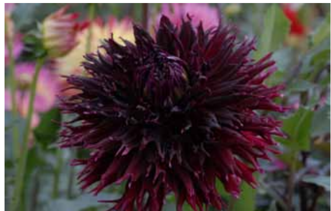
Dahlia 'Kenora Macop B'