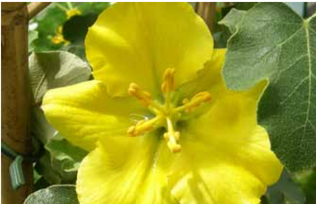
Fremontodendron californicum

Innerhalb der Ordnung Malvenartige ( Malvales ) gehört die Gattung Fremontodendron zur Familie der Malvengewächse ( Malvaceae ). Ob und in welche Unterfamilien sich die Malvaceae aufgliedern und wo