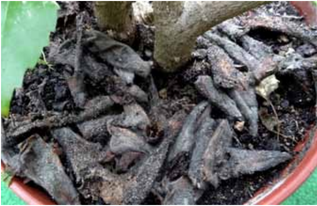
Grauschimmelbelag an Pflanzenresten

Pilzbelag. In Blumenfenstern oder Wintergärten kann der Grauschimmel, mit Blättern oder Blütenresten von Nachbarpflanzen auf Topfoberflächen fallen und sich