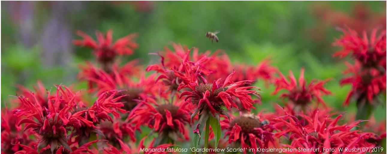
Monarda fistulosa 'Gardenview Scarlet' im Kreislehrgarten Steinfurt, Foto: W.Rusch 07/2019

Liebe Staudenfreundinnen, liebe Staudenfreunde,