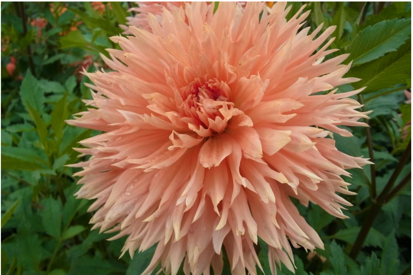
Ein Prachtexemplar: Die Sorte 'Uranus', ausgestellt von der Gärtnerei Wirth, Wien / Österreich

Die Züchter, namentlich die Hobbyzüchter, können trotzdem zufrieden sein. So eine Gelegenheit wird es nicht mehr geben, wann haben jemals Hobbyzüchter ihre Dahlien auf eine BUGA ausstellen dürfen. Erwähnenswert wäre noch, dass es keine Bestrebungen gab, Erfurter Dahlien anzupflanzen und besonders hervor zu heben. Bei der 'Juri Gagarin' stand nichts dazu und die 'Don Lorenzo' kam von Wirth. Es wären aber noch mehr Sorten greifbar gewesen. Ich hatte das schon vor zwei Jahren beim Tag der offenen Tür auf dem ega-Park angesprochen. Man wolle sich kümmern, so versprach man. Voriges Jahr das selbe Spiel, wieder Nachfrage, wieder leere Versprechungen. Wahrscheinlich hat es doch niemanden wirklich interessiert. Trotzdem war die BUGA in Erfurt eine gelungene Präsentation der Dahlie.