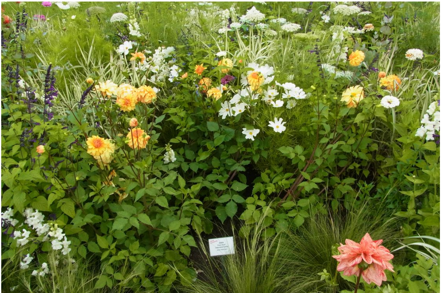
Dahlienneuheiten, stark umwachsen von anderen Pflanzen!