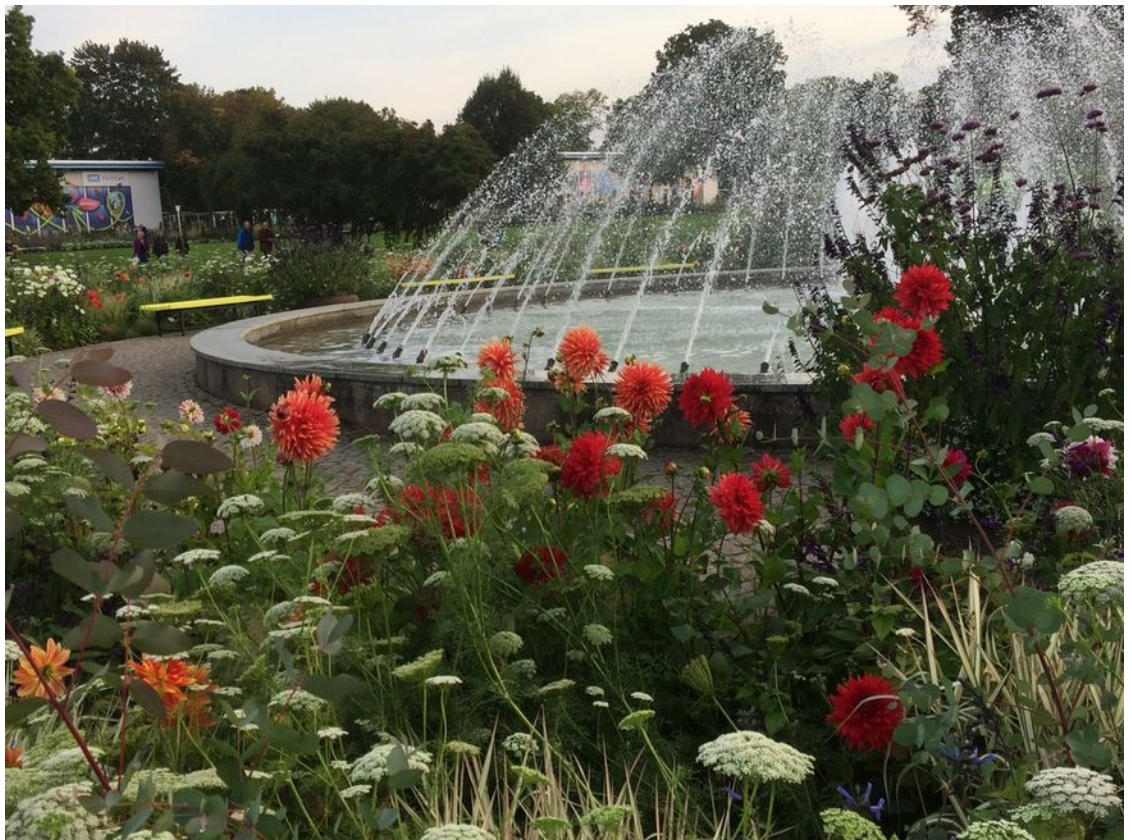
Die Prüfungsdahlien rund um den Springbrunnen im ega-Park.